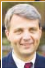
Dagfinn Høybråten – om helsereformen